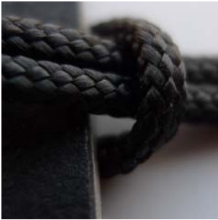
09-010-02 Cord Sort