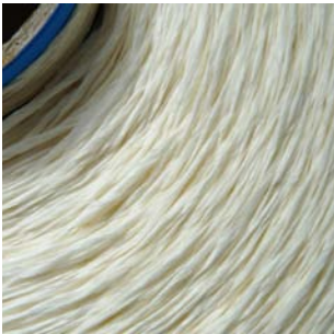
05-011-01 Abaca Papirgarn

Garnkortet 2017 er sendt ud og vi håber, at I vil tage godt imod det og lade jer inspirere. Som altid hører bestyrelsen meget gerne de tilbagemeldinger I måtte have. Er der særlige ønsker til næste års nye garner vil vi gøre hvad vi kan, for at opfylde dem. Tusind tak til de flittige hænder der hjalp os på garndagen i september, der som altid var givende dag fyldt med god inspirerende snak hen over bordet og udveksling af ideer. Tak til Væveværkstedet i Smallegade, Frederiksberg for igen at stille deres værksted til rådighed.