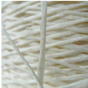
05-012-01 Abaca Papirgarn