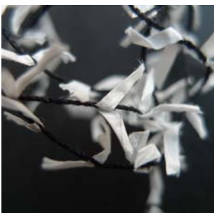
62-010-01 Papir Chenille Hvid