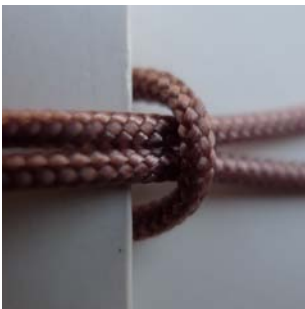
09-010-07 Cord Rødbrun

I finder garnerne under kategorien POLYESTER på webshoppen.